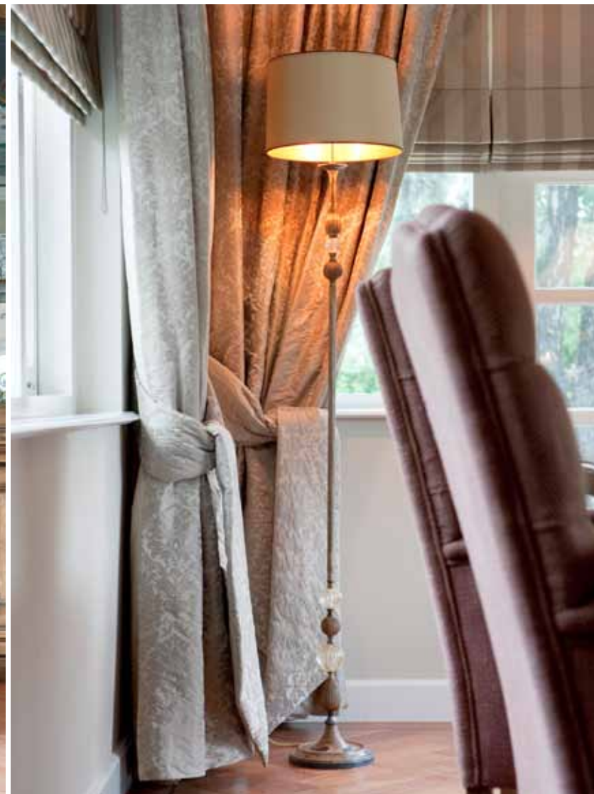
Foto rechterpagina: aan de voorkant van het huis bevindt zich in de erker het eetkamer gedeelte. Hier staat een grote tafel met zes stoelen, waar de familie Barendse vooral tijdens de feestdagen graag eet.