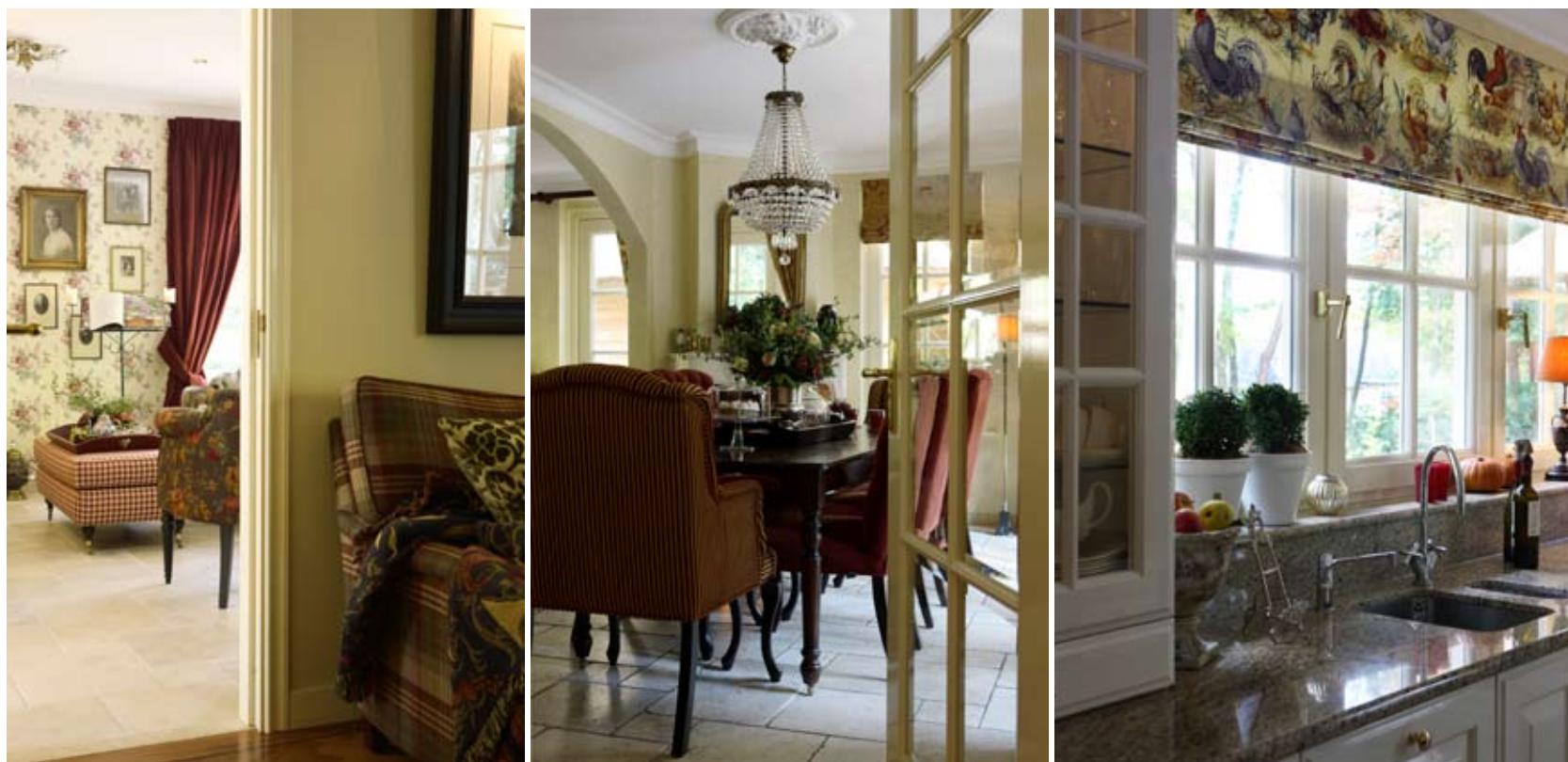
Foto rechts: de woonkeuken is de favoriete plek van de vrouw des huizes. “Als we gasten hebben, komen we vaak de hele avond de keuken niet meer uit”, zegt ze.