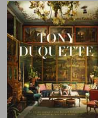
Tony Duquette inspireert tot het creëren van gedurfde combinaties.