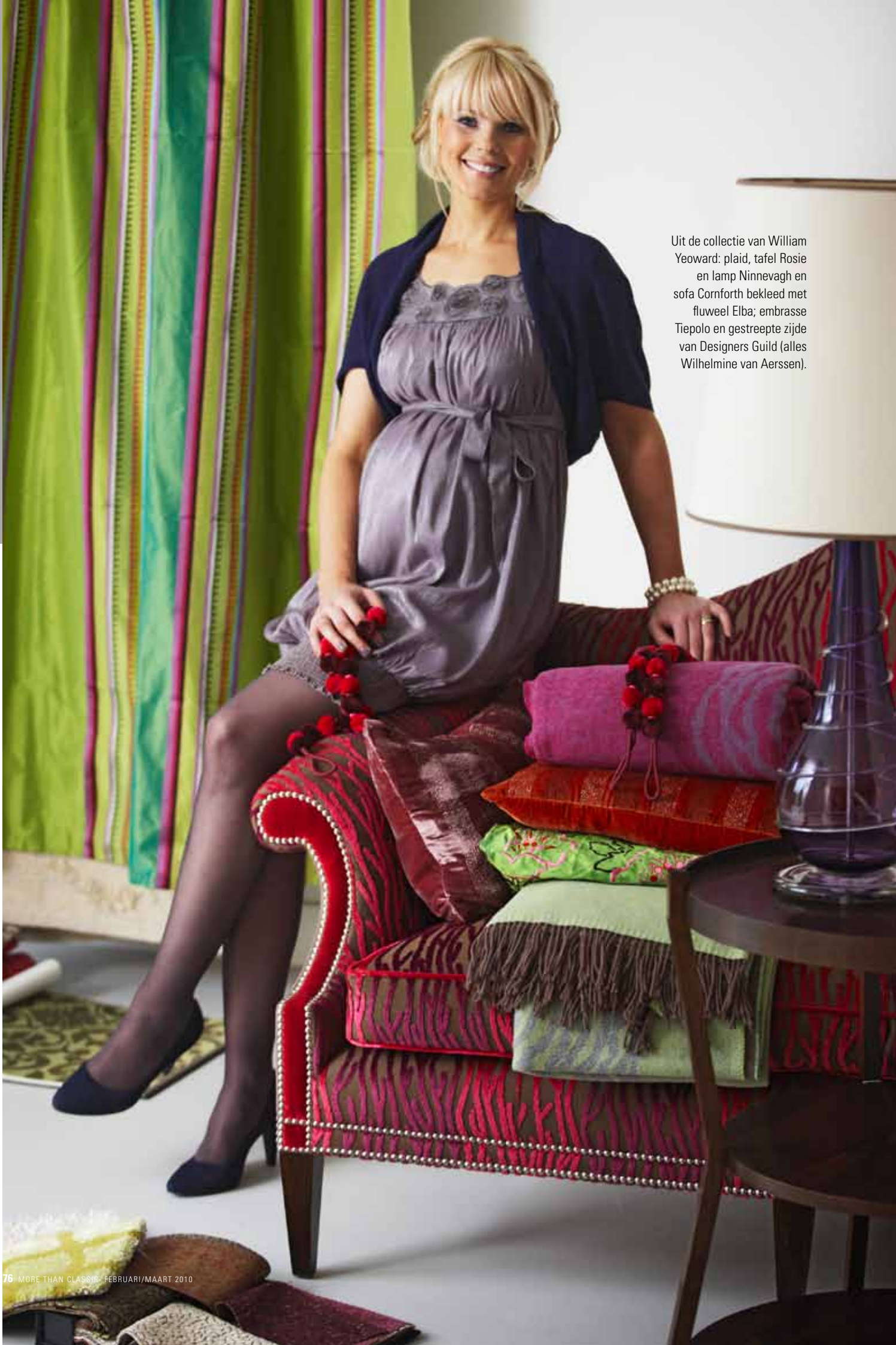
Uit de collectie van William Yeoward: plaid, tafel Rosie en lamp Ninnevagh en sofa Cornforth bekleed met fluweel Elba; embrasse Tiepolo en gestreepte zijde van Designers Guild (alles Wilhelmine van Aerssen).